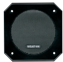
Art. No. 4642 *)