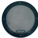
Art. No. 4670 *)