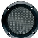
Art. No. 4640 *)