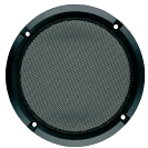
Art. No. 2062 *)