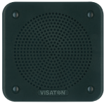
Art. No. 4639 **)